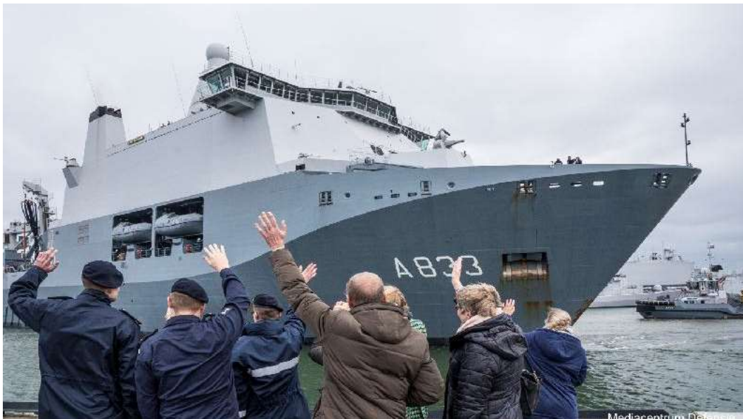
Uitzwaaien Zr. Ms. Karel Doorman