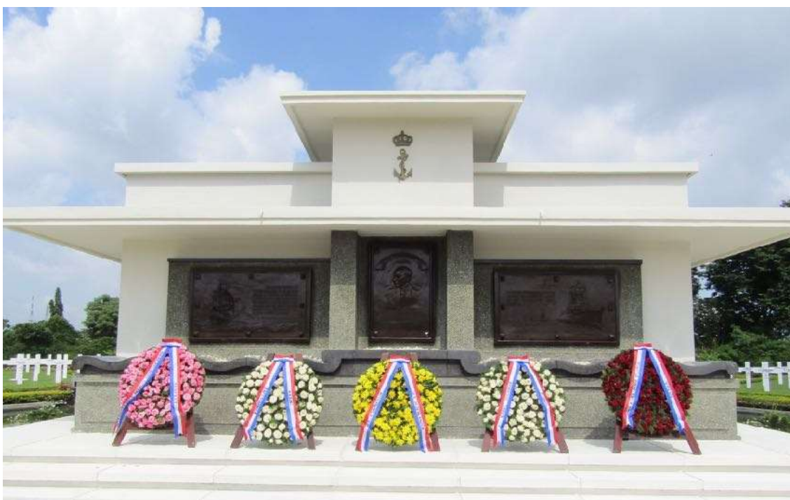
Herdenking 80 jaar Slag in de Javazee op de erebegraafplaats Kembang Kuning

De uitreiking van de aan het KDF verbonden "Hakkenberg" trofee heeft ook plaatsgevonden. Dit gebeurt tweemaal per jaar aan de "best man" van de onderofficiersopleiding bij het mariniersopleidingscentrum van de Van Ghentkazerne in Rotterdam.