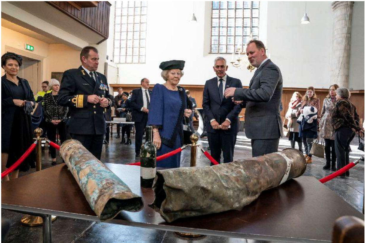
Beschermvrouwe van het fonds HKH Prinses Beatrix bekijkt de artefacten van de wrakken tijdens de 80-jarige herdenking van de slag in de Javazee.