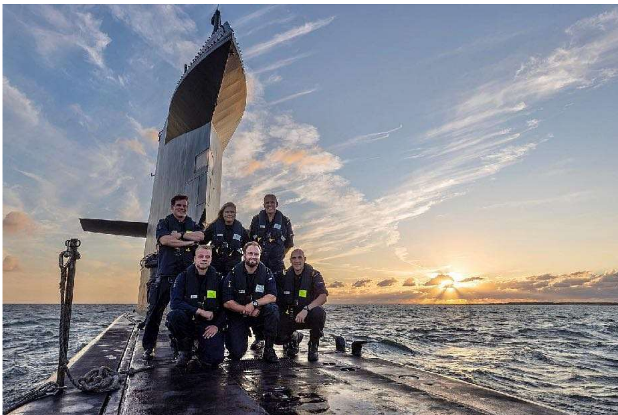
Hare Koninklijke Hoogheid Prinses Amalia op kennismaking bij de Koninklijke Marine.

Het bestuur streeft ernaar om de doelstellingen van het KDF zo goed mogelijk onder de aandacht van doelgroepen te brengen. Om de naamsbekendheid van het KDF verder te vergroten wordt bij donaties aan projecten verzocht de naam van het Karel Doorman Fonds te vermelden. Het bestuur werkt ook binnen haar netwerk om de naamsbekendheid van het KDF te vergroten. Immers de doelgroep moet in noodgevallen van het KDF weten te vinden. Naast de website kareldoormanfonds.nl heeft het KDF ook een Facebook pagina voor meer laagdrempelige communicatie.