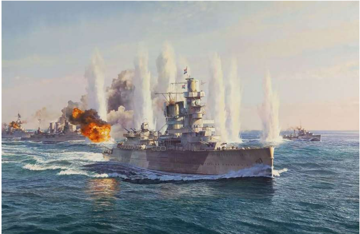
Schilderij Slag in de Javazee, geschonken tijdens de 80-jarige herdenking aan het marinemuseum

Ook werden er namens het KDF kransen gelegd in Bronbeek en op de erebegraafplaats Kembang Kuning in Indonesië.