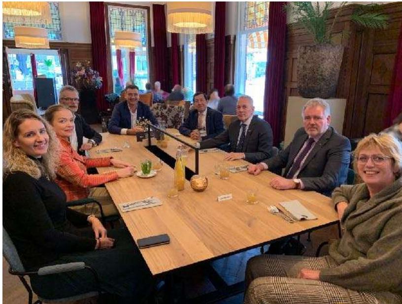
Bestuur KDF na afloop van de bestuursvergadering in Hotel de Wereld te Wageningen, najaar 2021

Het bestuur van het KDF was samen met overige militaire fondsen vertegenwoordigd bij een vergadering over schuldsanering, georganiseerd door de Staf van het Commando Landstrijdkrachten.