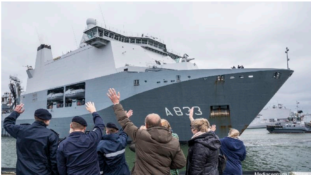
Uitzwaaien Zr. Ms. Karel Doorman