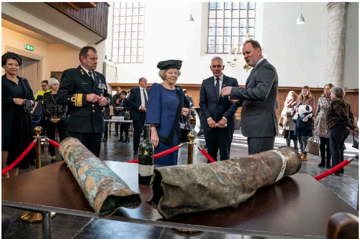
Beschermvrouwe van het fonds HKH Prinses Beatrix bekijkt de artefacten van de wrakken tijdens de 80 jarige herdenking van de slag in de Javazee.