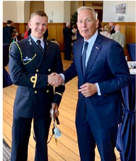
Felicities voor de Karel Doorman Sabel in 2022