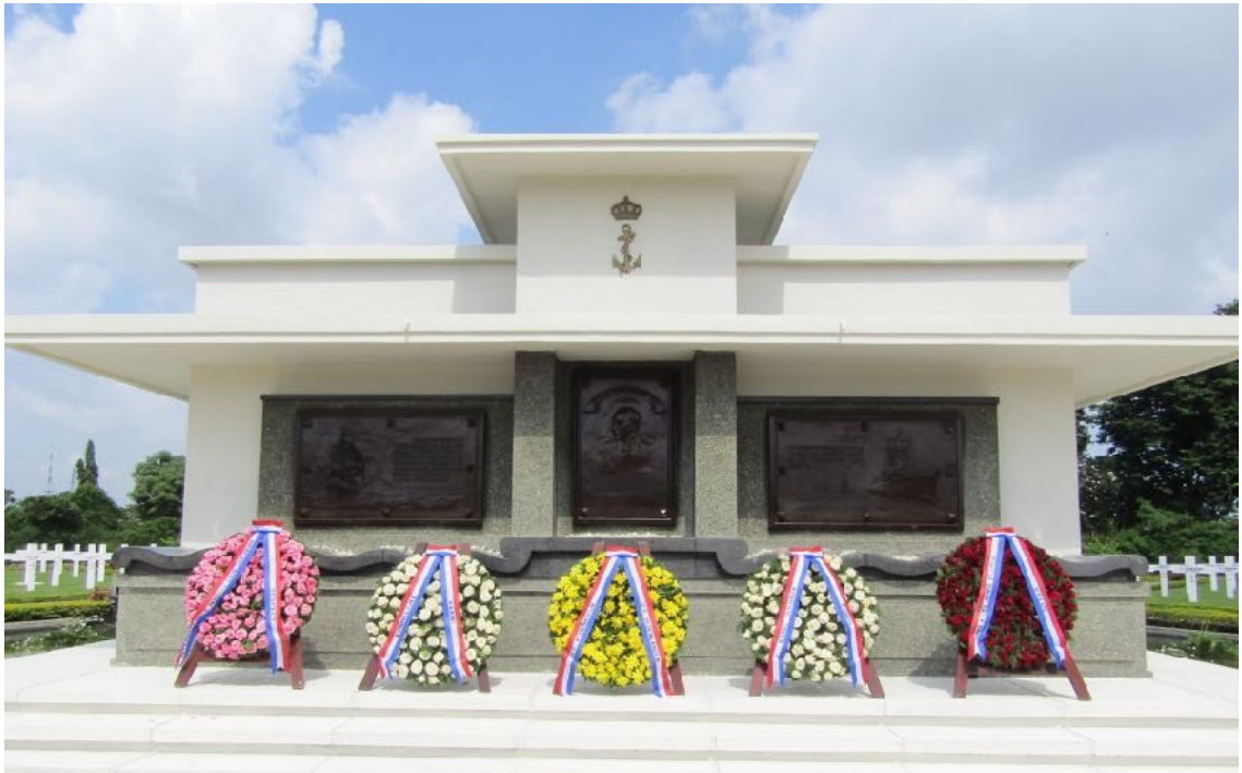
Herdenking Slag in de Javazee op de erebegraafplaats Kembang Kuning