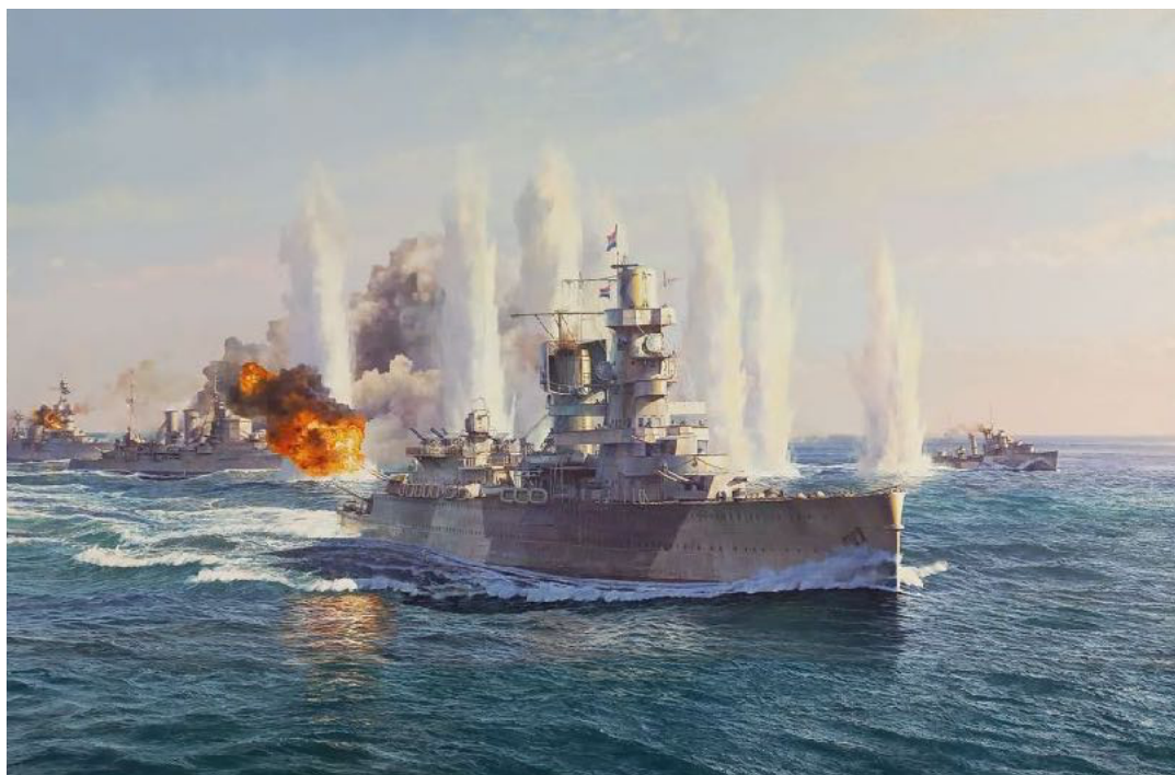
Schilderij Slag in de Javazee, geschonken tijdens de 80 jarige herdenking aan het marinemuseum